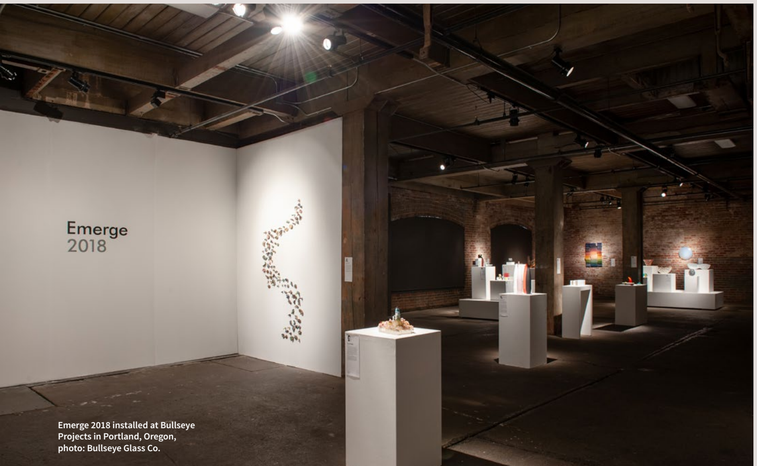
Emerge 2018 installed at Bullseye Projects in Portland, Oregon

however, upon surveying the breadth of contemporary kiln-glass today, one sees such a multiplicity of techniques that the term “kiln-glass” seems an ill-fitted vessel to carry them all. It is this diversity that has attracted artists and designers to this particular method of making. The ability of kiln-glass to mimic and harmonize with other media allows the idea to guide the work. Artists may lean into the obvious material qualities of glass or reject them entirely. It is the tension between the acceptance and rejection of our assumptions about glass, along with the