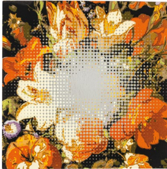
Kathryn Wightman: Dissociation, 2018, powdered glass, screenprinted and kilnformed, mirror, 21.25x43x0.875 inches (installed), photo: Tracey Grant Photography

tions“-Serie verbindet er Glasguss mit Materialien aus dem Alltag wie Kork oder Styropor. „Making Connections – Pink & Grey Arch“ ist ein rechteckig geformtes Bogenstück, dessen eine Hälfte aus Kork und die andere aus opakem Gussglas in pinken und grauen Farbschattierungen besteht. Kork und Glas weisen beide ungewohnte Formen auf und widersprechen damit unseren Vorstellungen von diesen beiden Materialien. Kunstvoll miteinander verbunden, erzeugen sie eine Spannung, die an unserem gesunden Menschenverstand rüttelt.