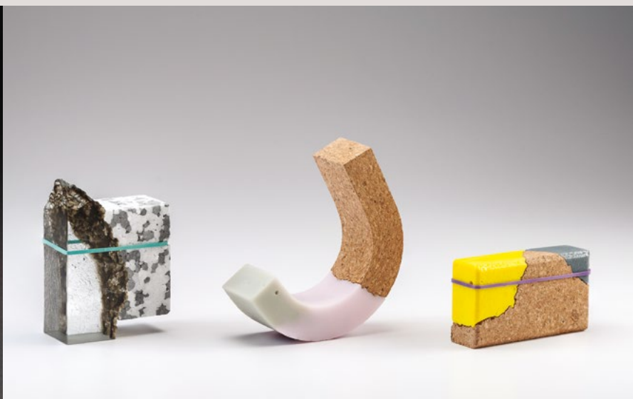
Joshua Kerley: Making Connections - Khaki Glass & Polystyrene, 2017, cast glass, polystyrene, rubber band, 4.75x3.375x1.75 inches & Making Connections - Pink & Grey Arch, 2017, cast opal glass and cork, 5.625x5x1.875 inches & Making Connections - Yellow & Grey Block, 2017, cast opal glass, cork, rubber band, 2.5x4.375x1.25 inches, *Gold Academic Award